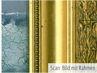
Scan Bild mit Rahmen