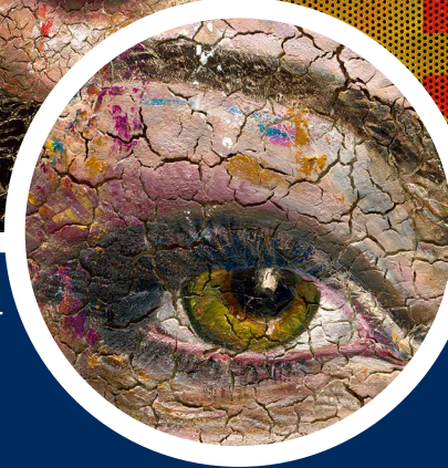
Bild oben: Scan vom Original 100 x 120 cm ▪ 300 dpi ▪ Textur