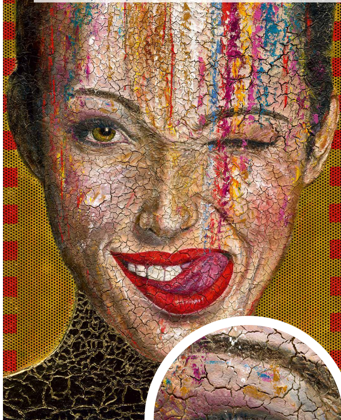
Kunst-Scan (Katja Nordmeyer: Amira, 100 x 120 cm, Mischtechnik auf Aluminium-Lochblech)

Der Cruse-Hochleistungsscanner scannt Vorlagen bis zu einer Größe von 180 x 120 cm berührungsfrei und gibt Oberflächenstrukturen und Farbigkeit perfekt wieder. Mittels ST-Scantechnik (ST = Synchron Table) – speziell für die Anforderungen von Dekorindustrie und Kunstreproduktion entwickelt – können auch große Vorlagen absolut gleichmäßig ausgeleuchtet und maximale Schärfe sowie exakte Parallelität erzielt werden. Der Vorlagentisch fährt dabei unter dem Lichtbalken hindurch.